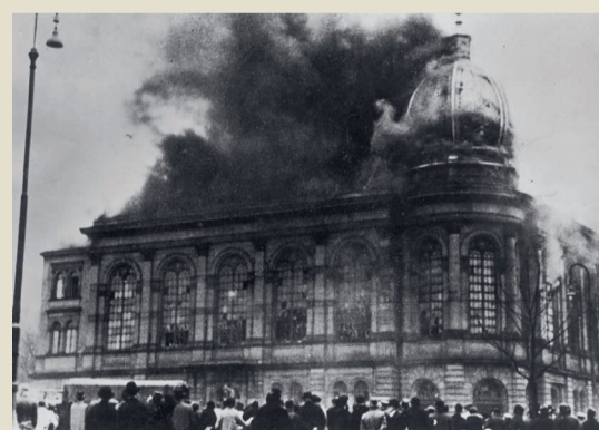
Am 10. November 1938 brennen Nazis die Synagoge am Börneplatz in Frankfurt am Main ab.