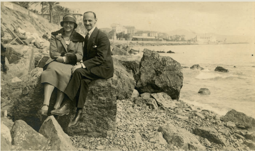
Edith und Otto reisen nach ihrer Hochzeit im Mai 1925 nach San Remo in Italien.

Am 12. Juni 1929 kommt Anne Frank zur Welt. Ihre Eltern Edith und Otto und ihre große Schwester Margot freuen sich sehr darüber. Die Familie Frank ist jüdisch und wohnt in einem Haus mit Garten in Frankfurt am Main. Sie haben viele Freund*innen in der Nachbarschaft.