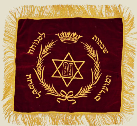
Fritz Pfeffer pflegt jüdische Traditionen. Er nimmt diese Challa-Decke mit in das Versteck. Damit werden Brote abgedeckt, die zum jüdischen Ruhetag Schabbat gegessen werden.