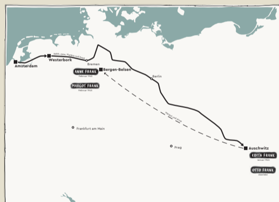
Diese Karte zeigt die Orte, an die die Familie Frank verschleppt wird.

Otto erlebt die Befreiung des Konzentrationslagers Auschwitz im Januar 1945. Er überlebt als Einziger der Untergetauchten. Die Armeen der Alliierten befreien nach und nach die von Deutschland besetzten Gebiete. Sie beenden im Mai den Zweiten Weltkrieg in Europa.