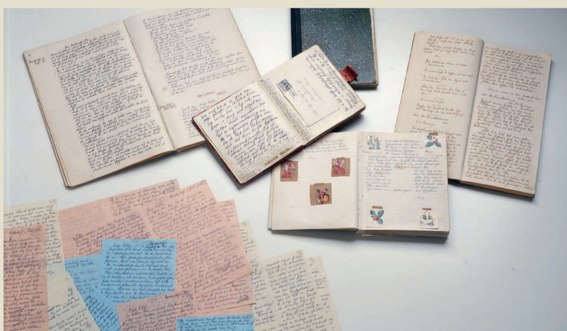
Diese Texte von Anne sind bis heute erhalten. Viele andere sind verloren gegangen, zum Beispiel das Tagebuch von Margot.