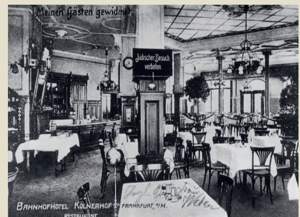
Antisemitismus gibt es in Deutschland schon lange. Diese Ansichtskarte zeigt ein Hotel in Frankfurt um 1900. Das Hotel wirbt damit, keine Jüdinnen*Juden als Gäste zu akzeptieren.