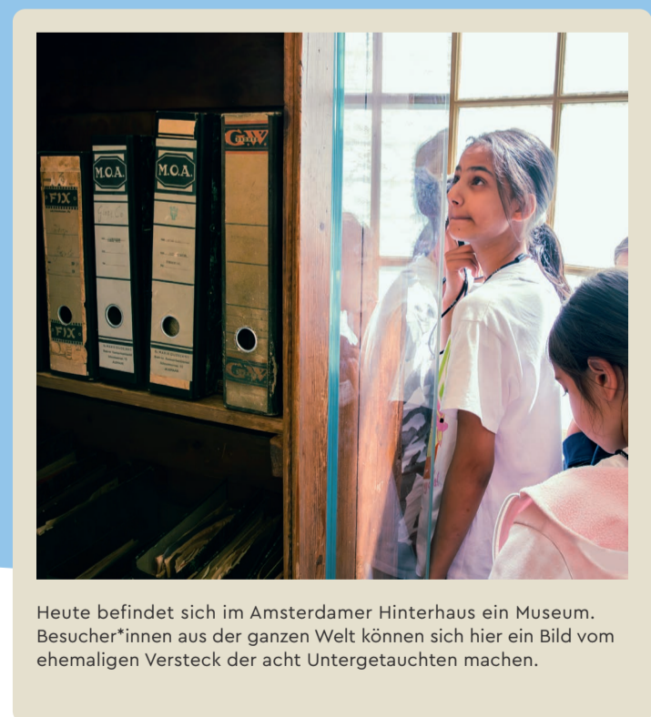
Heute befindet sich im Amsterdamer Hinterhaus ein Museum. Besucher*innen aus der ganzen Welt können sich hier ein Bild vom ehemaligen Versteck der acht Untergetauchten machen.

Die Ausstellung wurde im Rahmen des Anne Frank Tags 2026 entwickelt.