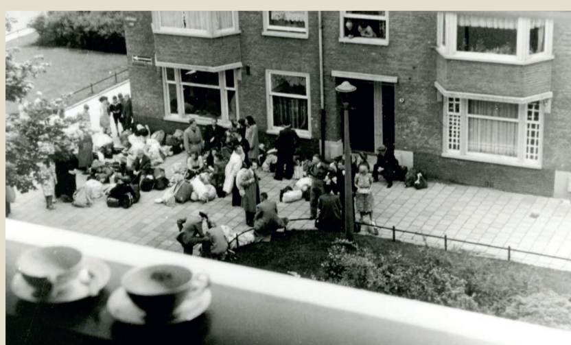
Am 20. Juni 1943 verhaftet die deutsche und niederländische Polizei mehr als 5.500 Jüdinnen*Juden in Amsterdam. Sie verschleppt sie in das Durchgangslager Westerbork. Dieses Foto wird geheim aufgenommen und zeigt die jüdischen Nachbar*innen vor ihrer Verschleppung.