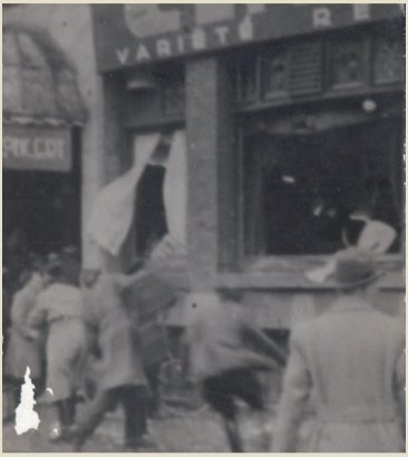
Im Februar 1941 überfallen niederländische und deutsche Nazis das Amsterdamer Theater Alcazar. Bei dem Überfall werden 23 Menschen verletzt. Im Alcazar treten jüdische Künstler*innen auf.