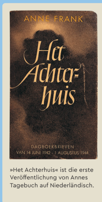
»Het Achterhuis« ist die erste Veröffentlichung von Annes Tagebuch auf Niederländisch.