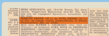
Otto sucht mit dieser Zeitungsanzeige nach seinen Töchtern. Eine Holocaust-Überlebende hat ihm kurz zuvor von Ediths Tod im Konzentrationslager Auschwitz erzählt.