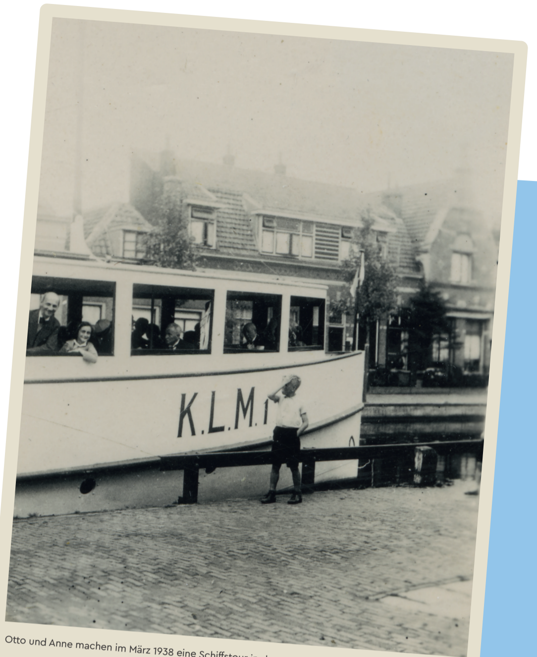
Otto und Anne machen im März 1938 eine Schiffstour in der niederländischen Stadt Leiden.

Am 1. September 1939 überfällt die deutsche Armee das Nachbarland Polen. Damit beginnt der Zweite Weltkrieg. Edith und Otto sorgen sich um ihre Familie. Sie fragen sich, wie sicher sie in den Niederlanden noch vor den Nazis sind.