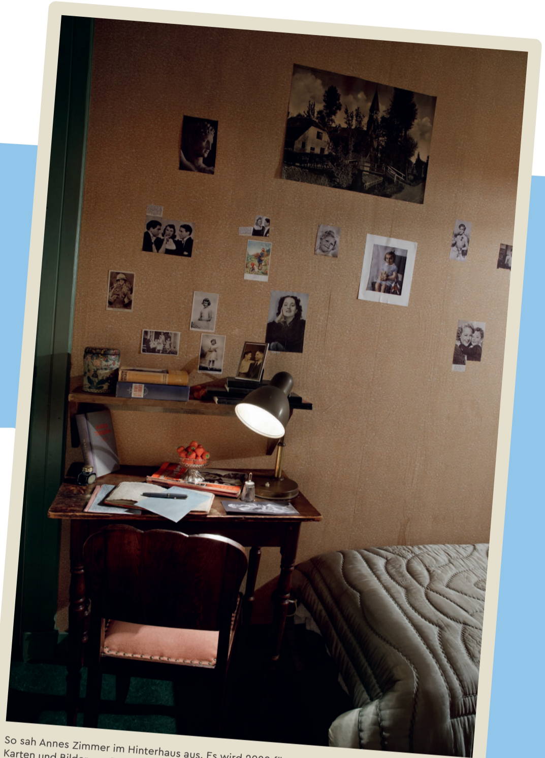
So sah Annes Zimmer im Hinterhaus aus. Es wird 2020 für einen Film nachgebaut. Anne klebt Karten und Bilder aus Zeitschriften an die Wand. An ihrem Schreibtisch schreibt sie Tagebuch.

Im Radio können die Untergetauchten hören, wie der Krieg verläuft. Sie alle hoffen, dass die Deutschen von den Alliierten besiegt werden und sie dann frei sind.