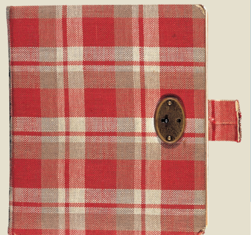
Anne bekommt dieses Tagebuch zu ihrem 13. Geburtstag geschenkt. Noch am selben Tag schreibt sie den ersten Eintrag.