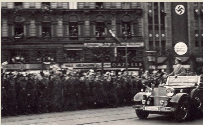
Adolf Hitler wird im März 1938 feierlich von Frankfurter*innen und dem Frankfurter Bürgermeister empfangen. Hitler hält wie in den Jahren zuvor eine Rede in der Festhalle.