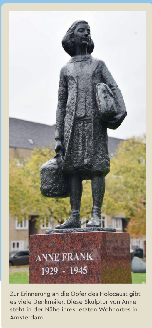
Zur Erinnerung an die Opfer des Holocaust gibt es viele Denkmäler. Diese Skulptur von Anne steht in der Nähe ihres letzten Wohnortes in Amsterdam.