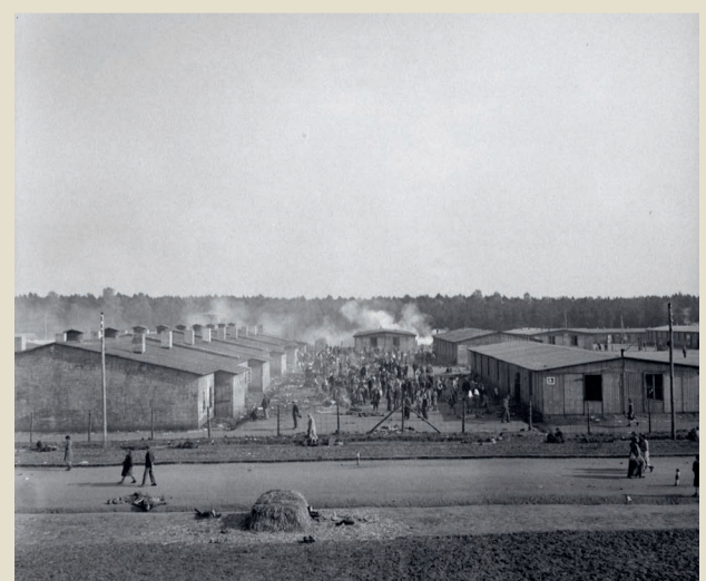
Die britische Armee befreit das Konzentrationslager Bergen-Belsen am 15. April 1945. Dieses Foto wurde wenige Tage später aufgenommen und zeigt die Baracken, in denen Inhaftierte leben mussten.