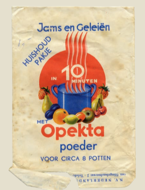
In Verpackungen wie dieser verkauft Opekta Geliermittel zur Herstellung von Marmelade.