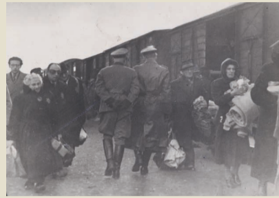
In Zugwaggons werden festgenommene Jüdinnen*Juden vom Durchgangslager Westerbork in Konzentrations- und Vernichtungslager gebracht. Dieses Foto 1943 wurde im Auftrag der Nazis gemacht.