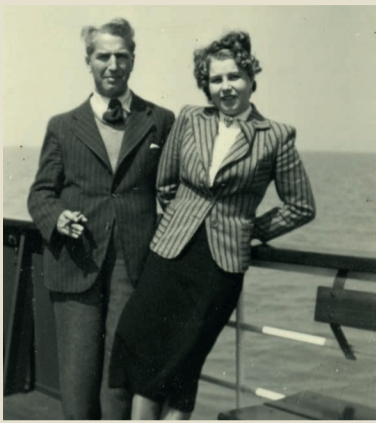
Fritz Pfeffer und seine Partnerin Charlotte Kaletta halten während seiner Zeit im Versteck Briefkontakt. Die Helferin Miep Gies übermittelt die Briefe. Dieses Foto zeigt sie 1939 noch zusammen in Freiheit.