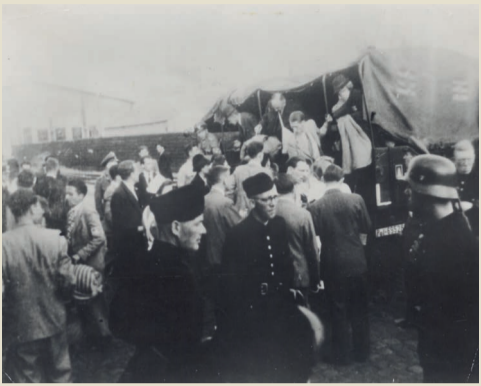
Verhaftete Amsterdamer Jüdinnen*Juden werden von der deutschen Ordnungspolizei zu einem Bahnhof verschleppt. Von dort bringt sie ein Zug in das Durchgangslager Westerbork. Dieses Foto wird 1943 von einem nationalsozialistischen Fotografen aufgenommen.