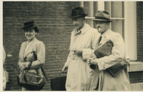
Dieses Foto zeigt Auguste und Hermann van Pels sowie Victor Kugler im Sommer 1941. Die beiden Männer arbeiten bei Opekta. Während der Zeit im Versteck hilft Victor den Untergetauchten.

Annes Eltern haben im Hinterhaus von Ottos Firma eine Wohnung eingerichtet. Dort versteckt sich die Familie Frank. Nach kurzer Zeit nehmen sie in ihrem Versteck weitere verfolgte Jüdinnen*Juden auf. Auf engstem Raum lebt die Familie zusammen mit Auguste und Hermann van Pels, ihrem Sohn Peter sowie dem Zahnarzt Fritz Pfeffer. Mit ihm muss sich Anne ein kleines Zimmer teilen.