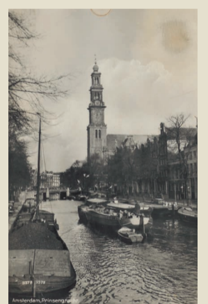
Die Ansichtskarte zeigt den Kanal Prinsengracht und die nahegelegene Kirche Westerkerk. Das Läuten der Kirchenglocken findet Anne beruhigend.